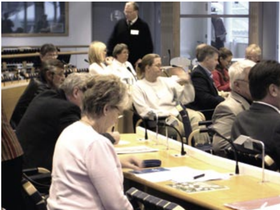
Ett 60-tal deltagare samlades i Skövde respektive Umeå för att orientera sig om hur kommunerna kan påverka tillgången till service.