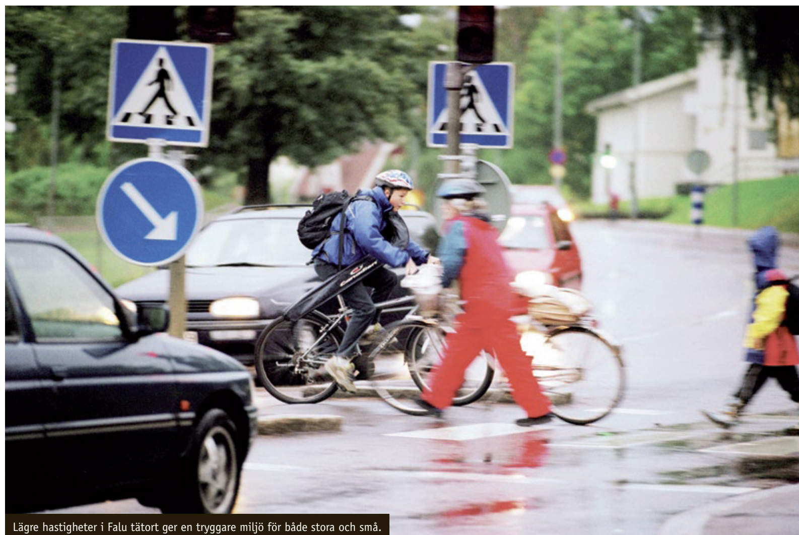
Lägre hastigheter i Falu tätort ger en tryggare miljö för både stora och små.

Rätt hastighet - för en attraktiv kommun.